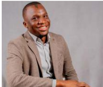
« Via la corruption, des opérateurs chinois sont en terrain conquis. »